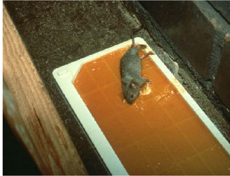
Un ejemplo de una tabla de pegamiento con un ratón muerto. Todos tipos de trampa necesitan estar contiguos a la pared o a ras del rincón adonde juntan un superficie vertical y otro horizontal.

Este artículo fue traducido por Megan Potter