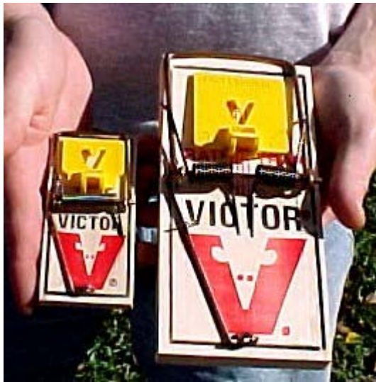
Una trampa que cierra con golpe, que se llaman “snap traps.”

A pesar de que tipo de trampa se escoge, póngalas contra a las paredes, detrás de objetos y en áreas retirados donde hay excrementos de ratón. Oriente las trampas que cierran con un golpe (snap traps) perpendiculares a la pared, con el extremo del gatillo contra el superficie vertical de la pared. Las trampas de captura múltiple, como Ketch-All, deben ser orientadas paralelas a la pared.